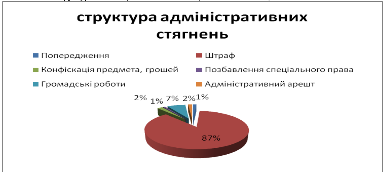
Малюнок 4 - Структура адміністративних стягнень (основні стягнення).

Додаткові стягнення застосовані до 19 осіб у вигляді конфіскації предмета, грошей.