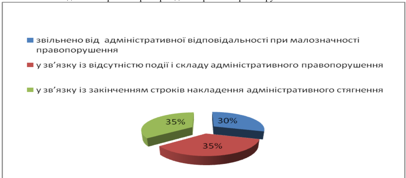
Малюнок -3 – підстави закриття справ про адміністративні правопорушення

Адміністративне стягнення накладене на 841 особу (59% осіб, щодо яких справи розглянуто). В тому числі, накладено адміністративних стягнень у вигляді: